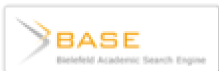
Bielefeld Academic Search Engine