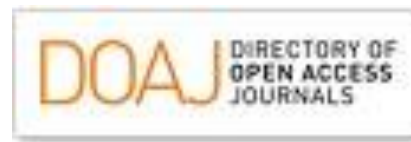
Directory of Open Access Journals